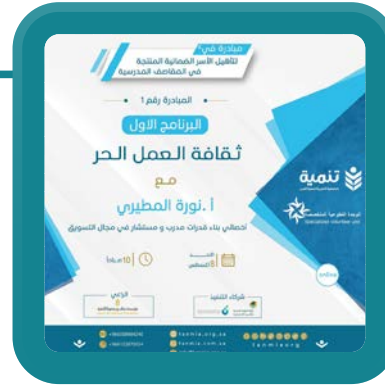
ثقافة العمل الحر