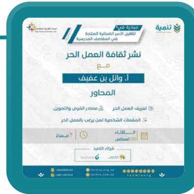
نشر ثقافة العمل الحر