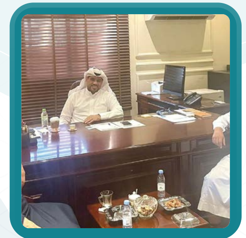
زيارة مؤسسة الشيخ علي الجفالي الخيرية