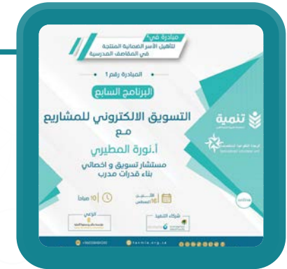
التسويق الإلكتروني للمشاريع