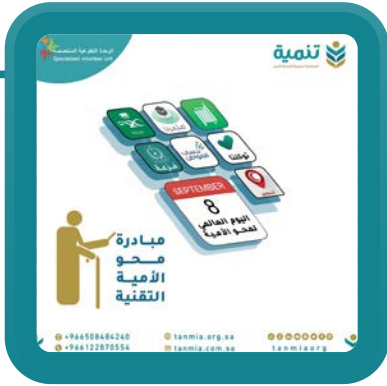
مبادرة محو الأمية التقنية