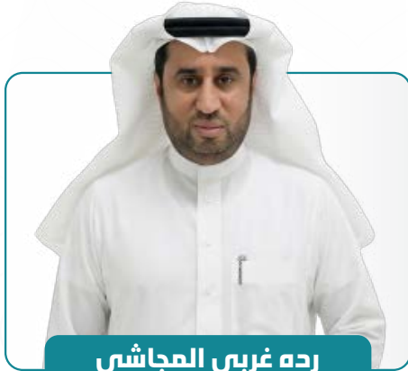
رده غربي العجاشي