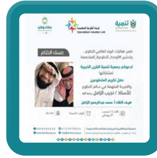
حفل تكريم المتطوعين بالجمعية