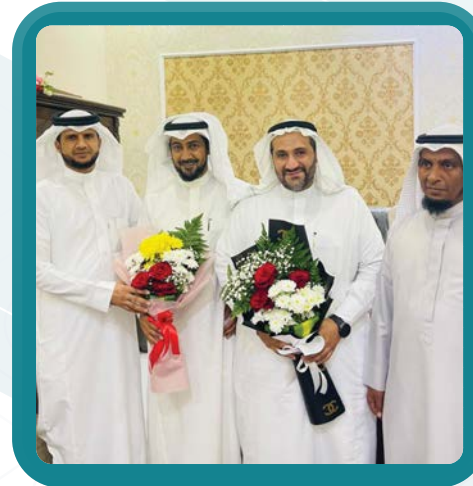
زيارة جمعية الشباب بحلي