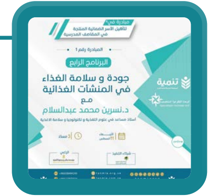
جودة وسلامة الغذاء في المنشآت الغذائية