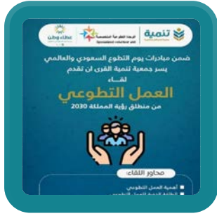
لقاء العمل التطوعي من منظور رؤية المملكة 2030