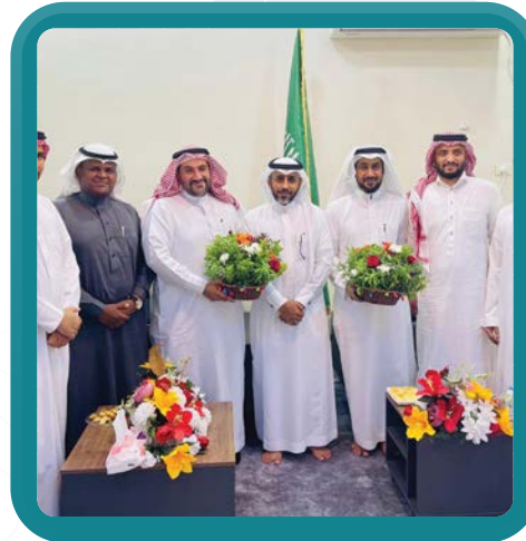
زيارة جمعية بصمة شباب التطوعية بالقوز