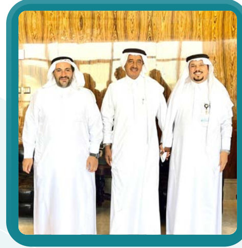
زيارة الشيخ عبدالإله درويش