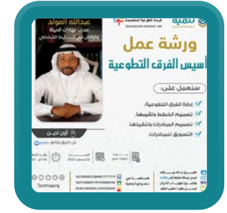
ورشة عمل تأسيس الفرق التطوعية