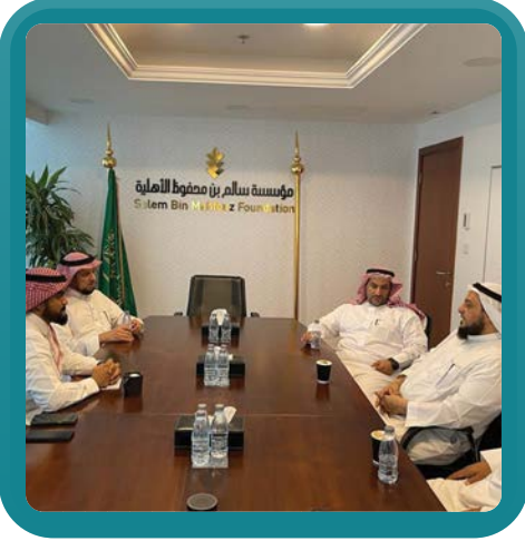
زيارة مؤسسة سالم بن محفوظ