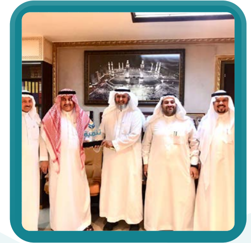
زيارة الشيخ عبدالله الجهيج