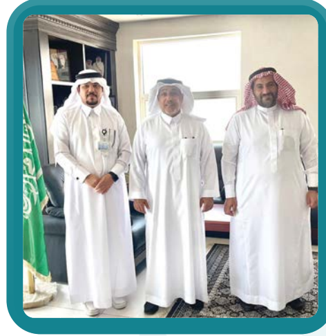
زيارة الشيخ عبدالعزيز السريع