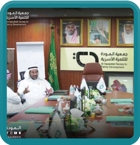
زيارة جمعية الموودة للتنمية الاسرية